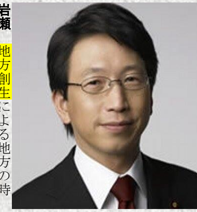
座談会 平 将明氏